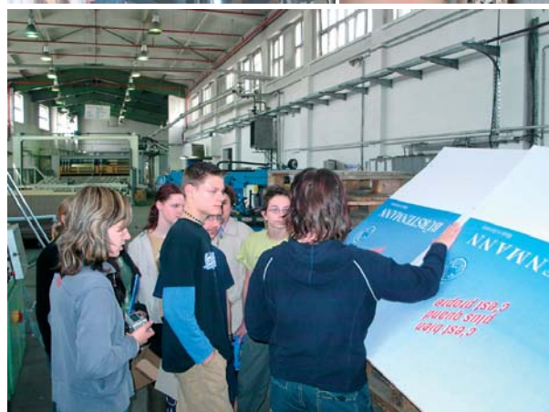
KURS 21 im Altenburger Land - Die Bilder zeigen Szenen aus der Zusammenarbeit des Wellpappenwerkes Lucka mit der benachbarten Regelschule. Im Altenburger Land wird KURS 21 durch den Landkreis vorangetrieben. Im Juni unterzeichnete Landrat Sieghardt Rydzewski eine entsprechende Vereinbarung.

senschaft Nöbdenitz e.G. oder die Thorey Textilveredelung GmbH in Gera, als auch global player wie die Carl Zeiss Jena GmbH, SCHOTT JENAer GLAS GmbH oder TRUMPF Medizin Systeme GmbH in Saalfeld nehmen ihre Chancen in der Zusammenarbeit mit einer Nachbarschule wahr.