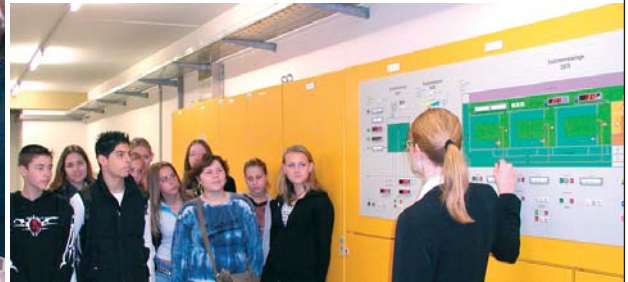
KURS 21 in der Region Wuppertal - Workshop „Sekundärtugenden oder Teamregeln?“ in der Lernpartnerschaft der Barmenia Versicherungen mit dem Gymnasium Vohwinkel (Bild links); Staatssekretär Rezzo Schlauch zeichnet Azubis von Bayer HealthCare aus (Bild rechts oben); eine Mitarbeiterin der Wuppertaler Stadtwerke erläutert Schülerinnen und Schülern der Realschule Leimbacher Straße den „Weg des Wassers“ im Wasserwerk in Herbringhausen (Bild rechts unten)

Azubis und Schülern Tugenden und Laster aufgelistet und diese in einer Ranking-Liste nach Wichtigkeit und Wirkung (positiv und negativ) gewichtet. Anschließend bearbeiteten Azubis mit den Schülern in fünf Kleingruppen einen der Themenkomplexe Familie, Freunde, Schule, Unternehmen und Glaube. Für diese Themenkomplexe wurden aus einer Tugendliste eine Auswahl der für diesen Bereich wichtigsten Tugenden erstellt. Die Aufgabe der Kleingruppe bestand darin, den in jedem Fall versteckten moralischen Konflikt zu diskutieren und sich auf eine Lösung zu einigen.