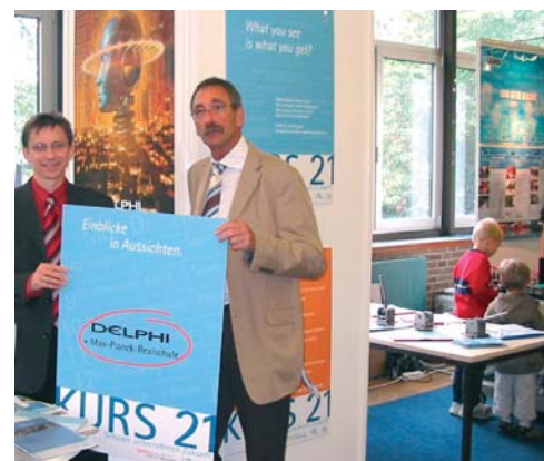
Präsentation von KURS 21 im Rahmen der Bergischen Innovationsbörse

Bei den Bemühungen um eine Institutionalisierung von KURS 21 ist es besonders wichtig, die vorhandenen Initiativen in der Region mit dem Fokus Schule-Wirtschaft zu bündeln und existierende Strukturen zu nutzen bzw. mit einzubeziehen. Für die langfristige Verankerung von KURS 21 im Bergischen Städtedreieck kooperiert das Wuppertal Institut mit der Stiftung „Zukunftsfähiges Wirtschaften im Bergischen Städtedreieck“, die gemeinsam von den Stadtwerken der Städte Remscheid, Solingen und Wuppertal und den Wirtschaftsförderungen der Städte Solingen und Wuppertal im Jahr 2003 gegründet wurde.